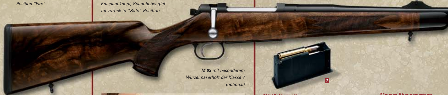
M 03 mit besonderem Wurzelmaserholz der Klasse 7 (optional)