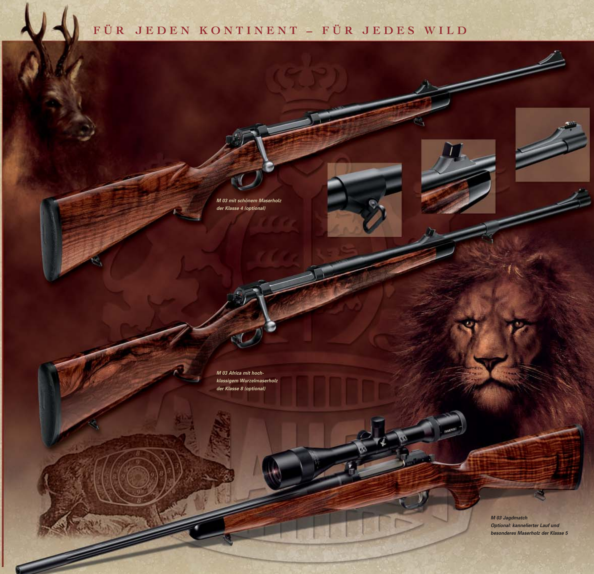
M 03 mit schönem Maserholz der Klasse 4 (optional)

Jagdschützen mit Ambitionen für den sportlichen Wettbewerb nutzen die optimale Anschlagstabilität und das souveräne Schwingverhalten der M 03 Jagdmatch für beste Ergebnisse. Sie verbindet erstklassige Balance mit hervorragender Schussleistung. Auf Wunsch sorgt ein kannelierter Matchlauf für verbesserte Wärmeabgabe. M 03 Matchläufe sind auch als Wechselläufe erhältlich.