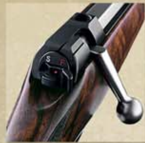
Spannen: Spannhebel auf Position "Fire"

Die Kornperle aus Neusilber hebt sich kontrastreich ab. Die Kimme ist seitlich, das Korn in der Höhe verstellbar.