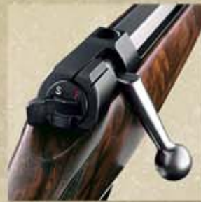
Entspannen: Druck auf den Entspannkopf, Spannhebel gleitet zurück in "Safe"-Position