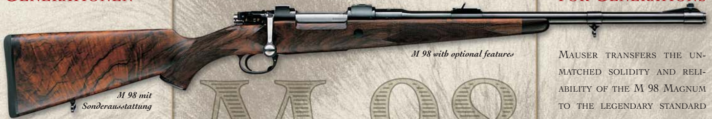
M 98 mit Sonderausstattung